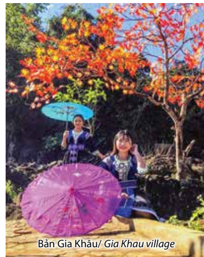
Bản Gia Khâu/ Gia Khau village

LAI CHAU CITY - GIA KHAU VILLAGE - VANG PHEO VILLAGE - TEMPLE AND STELE OF KING LE THAI TO - LAI CHAU HYDROPOWER PLANT