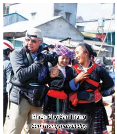
Phiên Chợ San Thàng San Thang market day