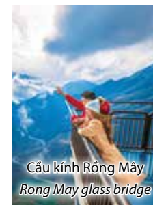
Cầu kính Rồng mây Rong May glass bridge