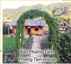
Bản Phiêng Tiên Phieng Tien village