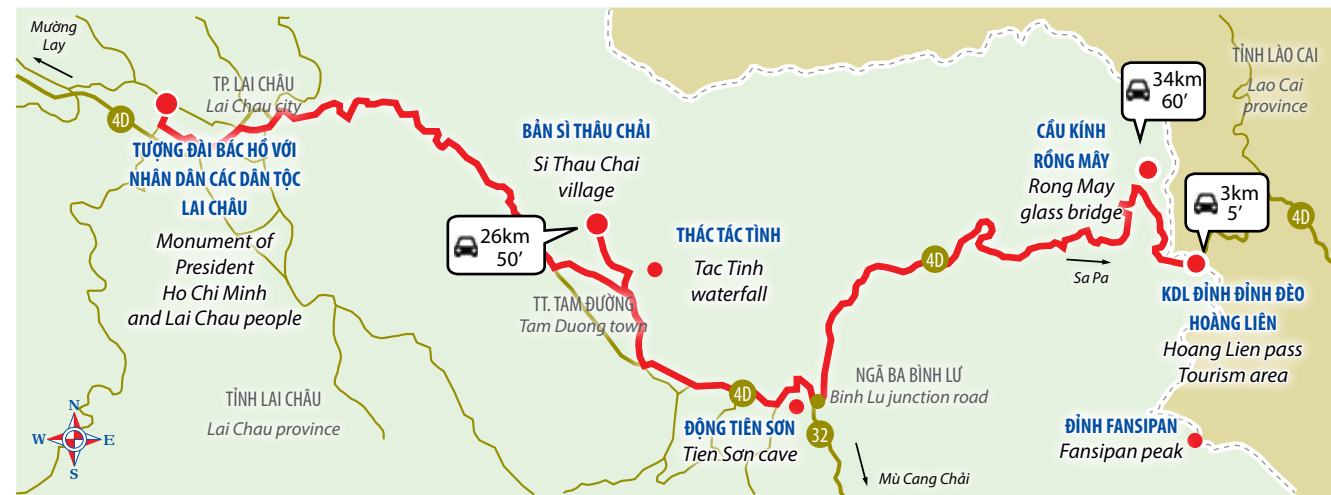
Khu du lịch sinh thái đỉnh đèo Hoàng Liên Hoang Lien pass eco-tourism area

LAI CHAU CITY - SI THAU CHAI VILLAGE/ PARAGLIDING - RONG MAY GLASS BRIDGE - HOANG LIEN PASS TOURISM AREA