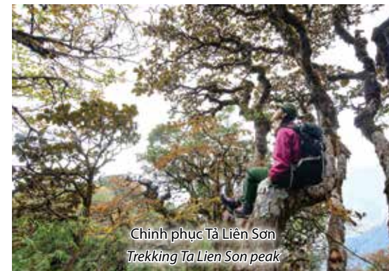
Chinh phục Tả Liên Sơn Trekking Ta Lien Son peak