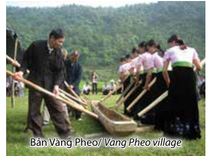
Bản Vàng Pheo/ Vang Pheo village