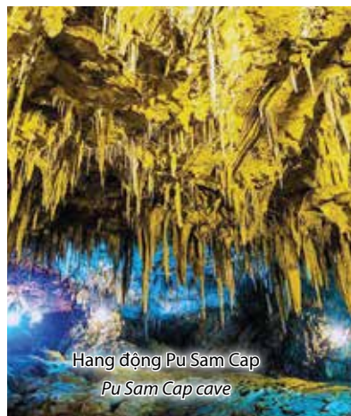
Hang động Pu Sam Cap Pu Sam Cap cave