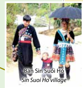
Bản Sìn Suối Hồ Sin Suoi Ho village