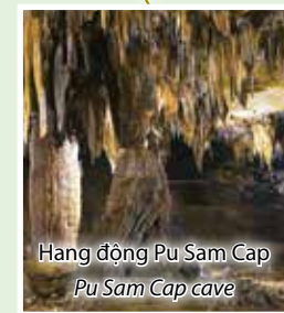
Hang động Pu Sam Cap Pu Sam Cap cave