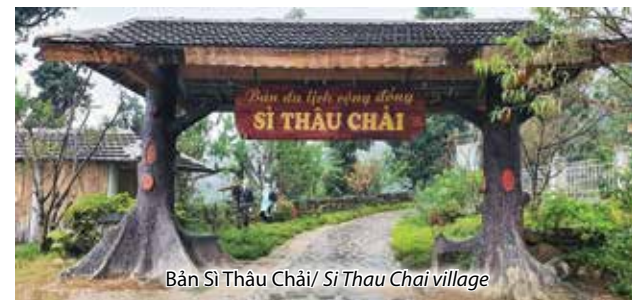
Bản Sỉ Thầu Chải/ Si Thau Chai village