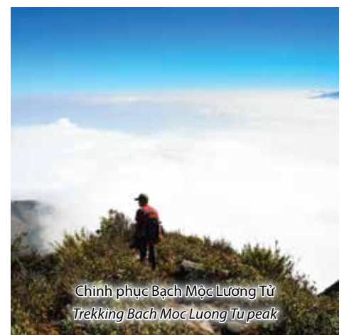
Chinh phục Bạch Mộc Lương Tử Trekking Bach Moc Luong Tu peak