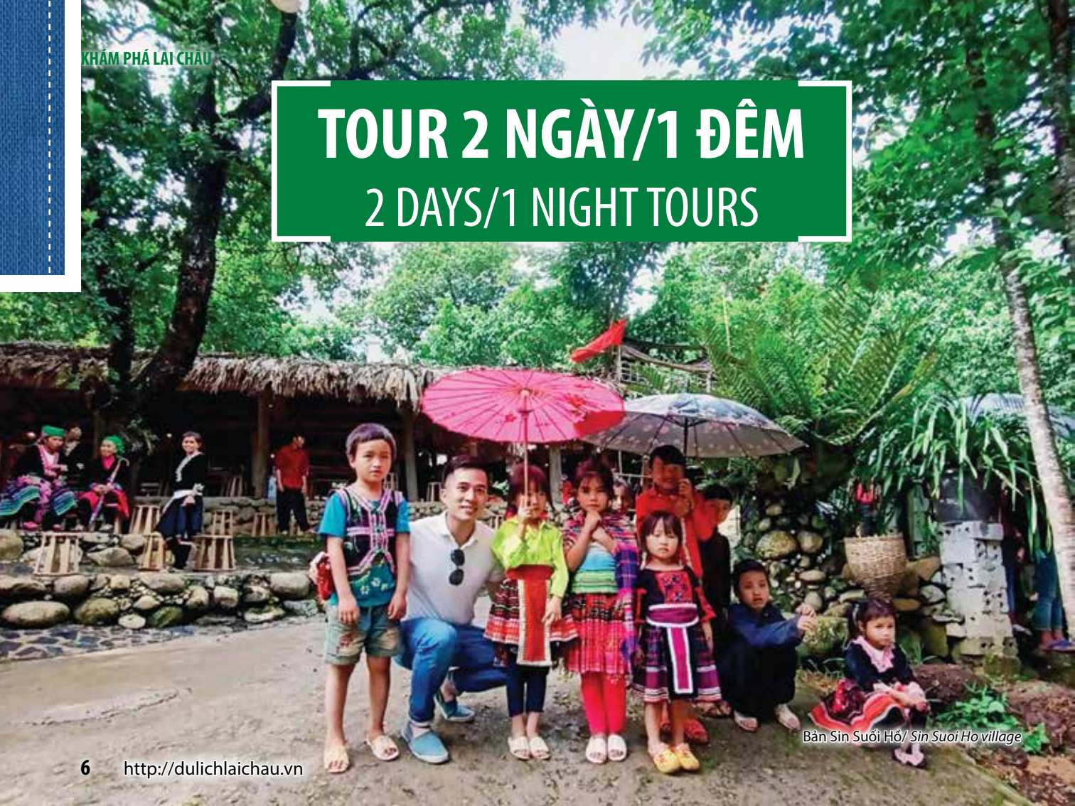
Bản Sin Suối Hồ/ Sin Suoi Ho village