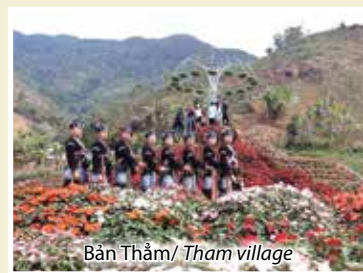
Bản Thẩm/ Tham village