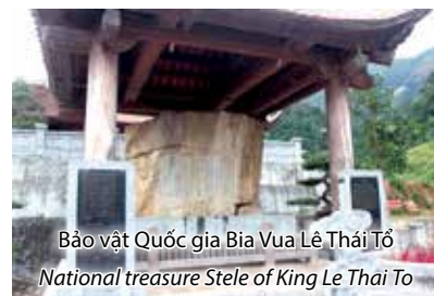
Bảo vật Quốc gia Bia Vua Lê Thái Tổ National treasure Stele of King Le Thai To