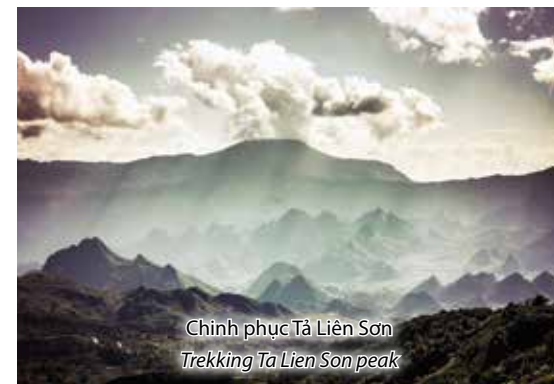
Chinh phục Tả Liên Sơn Trekking Ta Lien Son peak