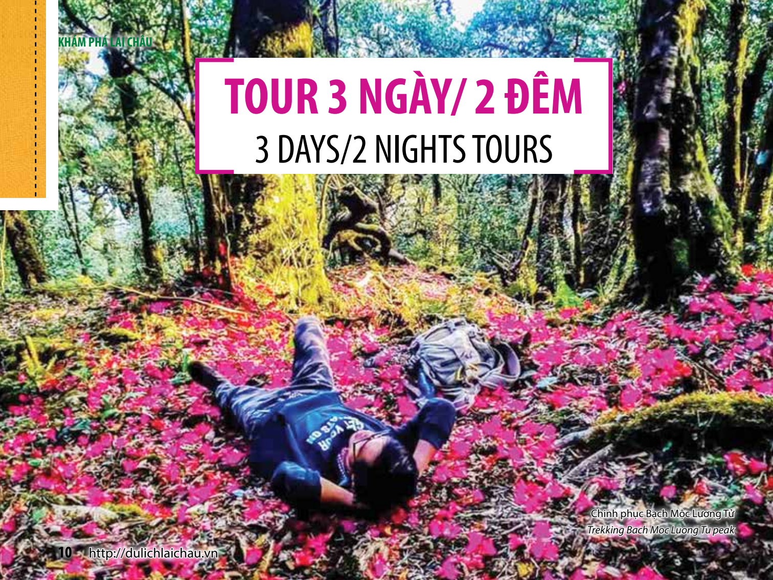
Chinh phục Bạch Mộc Lương Tử Trekking Bach Moc Luong Tu peak