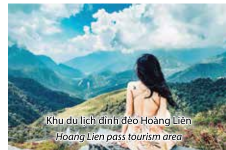
Khu du lịch đỉnh đèo Hoàng Liên Hoang Lien pass tourism area