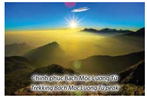
Chinh phục Bạch Mộc Lương Tử Trekking Bach Moc Luong Tu peak