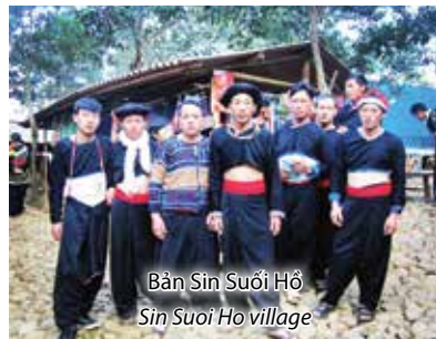
Bản Sin Suối Hồ Sin Suoi Ho village

LAI CHAU CITY - PU SAM CAP CAVE - SIN SUOI HO VILLAGE