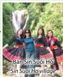
Bản Sin Suối Hồ Sin Suoi Ho village