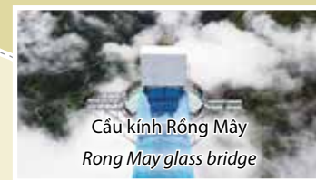
Cầu kính Rồng Mây Rong May glass bridge